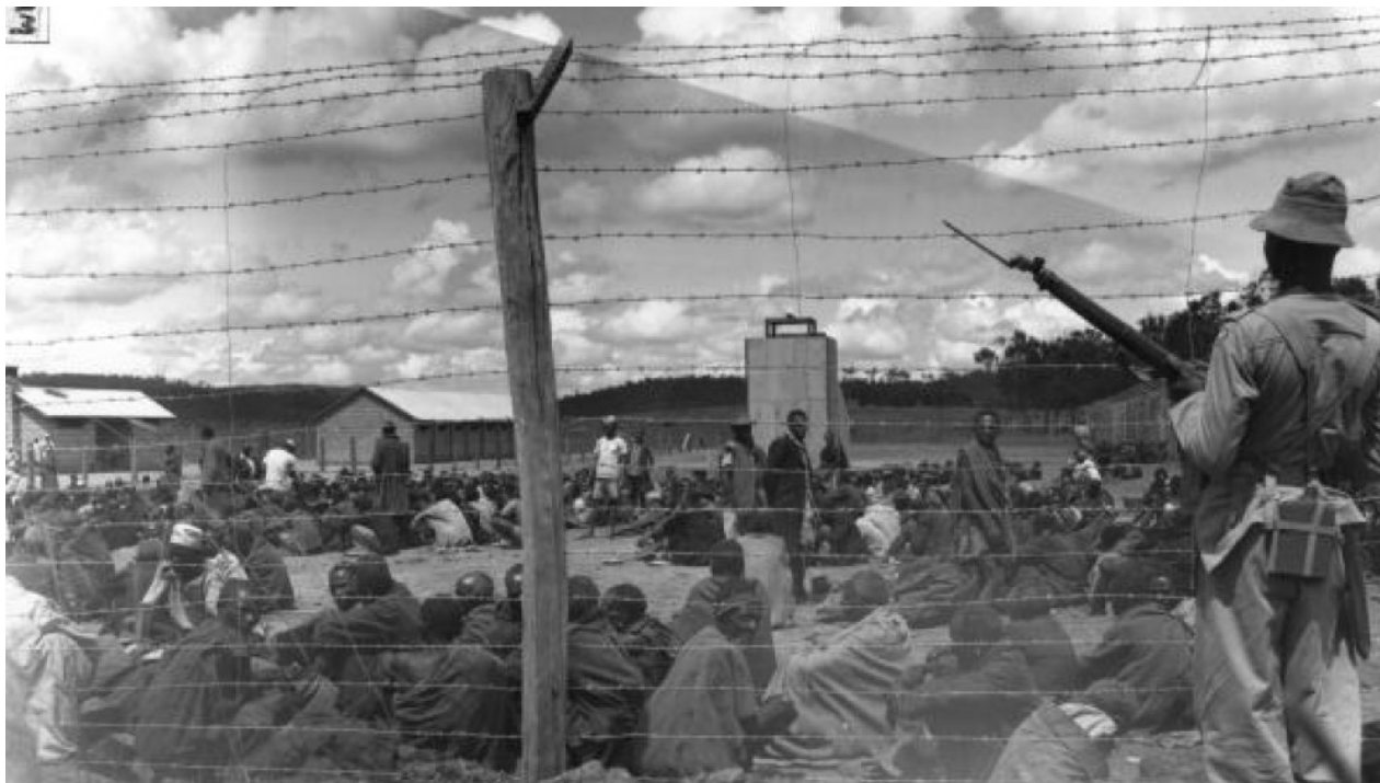
1953. godina, pripadnici plemena Kikuyu u logoru u Keniji

Kada joj je 2008. zazvonio telefon. Zvala je odvjetnička tvrtka iz Londona koja je preuzela slučaj i pripremala tužbe za odštetu u ime starijih Kenijaca koji su bili mučeni u logorima tijekom Mau Mau ustanka . Upravo je njezino istraživanje te tužbe učinilo mogućima. Odvjetnik koji je pokrenuo slučaj želio je da Elkins bude stručni svjedok. Pristala je jer je željela da se ispravi nepravda, a ona je stajala iza svog rada.