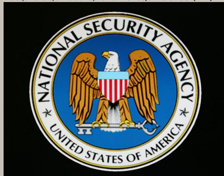
Motrenje elektroničkih komunikacija

Nacionalna sigurnosna agencija (NSA) SAD-a tu je tehničku mogućnost izgledno do neke mjere dala na korištenje Komunikacijskome stožeru uprave Ujedinjene Kraljevine Velike Britanije i Sjeverne Irske (UK) , Ustoličenju komunikacijske sigurnosti Kanade , Australskoj upravi datih znaka i Zavodu komunikacijske sigurnosti uprave Novoga Zelanda (NZ) .