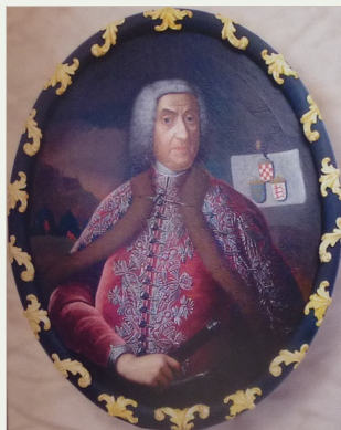
Graf Ivan Drašković

godine, tradicionalno glavni grad Zagreb ponovo je postao upravnim središtem. Hrvatski stališi su u Hrvatskom namjesničkom vijeću, osnovanom 1767. godine (Vijeće su sačinjavali ban i pet savjetnika imenovanih od carskog dvora, a zasjedalo je u Varaždinu), vidjeli opasnost za tradicionalna prava Sabora te su se, uz svesrdnu potporu ugarskih staleža, založili za ukidanje te ustanove. Tako je hrvatsko plemstvo, potpomognuto hrvatskim masonima kojih je već znatan broj bilo i u Saboru, Hrvatsku 1790. godine izručilo ugarskoj hegemoniji. U toj su odluci Mađari vidjeli ostvarenje svog sna o stvaranju mađarske nacionalne države od Karpata do Jadrana.