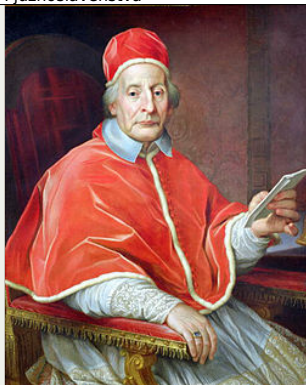
Papa Klement XII.