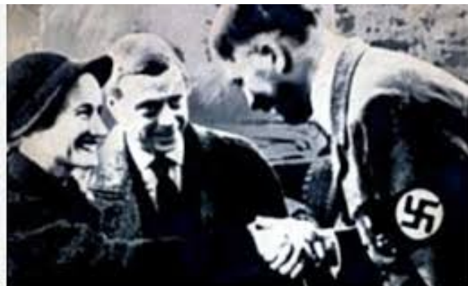
Hitler with the Duke and Dutchess of Windsor.