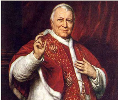
Papa Pio IX.

Međutim, implementacija tih dogovora ako se dogodi na nižim razinama Katoličke Crkve, može biti krajnje pogubna jer mnogi progresivistički svećenici zahvaćeni imanentizmom i laicizmom pokleknuti će pred onima koji gaje neskrivenu mržnju prema Riječi Božjoj. Iako masoni žive u smrtnom grijehu i ne mogu nazočiti Svetim sakramentima mnogi vjernici (većina ih i ne zna za te odredbe) pristupaju masonskom bratstvu kako bi sebi osigurali karijeru u profesionalnim zanimanjima, ali čine to i neki „progresivni“ svećenici koji jako dobro znaju za te odredbe.