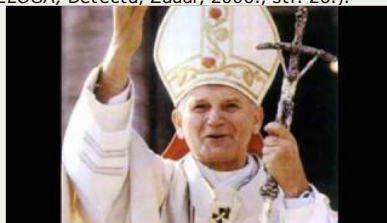
Papa Ivan Pavao II.

Papa Ivan Pavao II., tijekom Angelusa s vjericima na Prvu korizmenu nedjelju 2002. godine drhtavim glasom govorio je kako je Sotona stvarnost koja neprestano djeluje na čovjekove putove i putove Crkve. Oni koji žele umanjiti značaj te činjenice dovode se u opasnost i na kraju se suočavaju s gorkim razočarenjem; to je pogreška s bolnim posljedicama. Papa je tako svoje riječi zaključio na neobičan način, dva puta naglašeno rekavši: „ Odlazi Sotono! “ (Milivoj Bolobanić, Kako prepoznati zamke ZLOGA, Detecta, Zadar, 2006., str. 26. ).