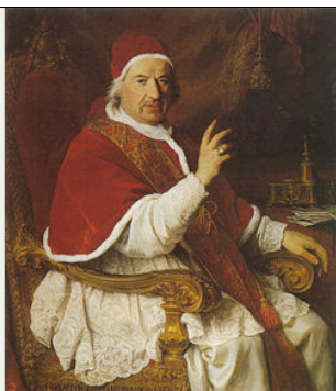
Papa Klement XII.

Papa Lav XIII., nadalje iznosi kako je plan masonstva Papi oduzeti svu duhovnu moć, a instituciju rimskog pontifikata izbrisati s lica zemlje. Pod pojmom izjednačavanja svih religija, pa i onih najdevijantnijih, želi se uništiti Katolička crkva. Masonstvo se uvuklo u srca pojedinih vladara, kaže Papa, tako da su ta društva i države odbacili kršćanske tradicije, brakove sklapaju i razvrgavaju kao građanske ugovore, u obrazovanje djece u takvim društvima ne smiju se uplitati nikakve religije, a kada odrastu, djeca sama odabiru religiju koja im se najviše sviđa. Sloboda umjetnosti, pornografija i strast zamijenili su mjesto s kršćanskim naučavanjem. „U nastojanju i zastrašujućem pokušaju da se ožive poganski običaji i institucije i želi da se uništi vjera i Crkva, čovjek će prepoznati neukročenu mržnju i osvetnički bijes koji je protiv Isusa Krista planuo u Sotoninom srcu“, rekao je na kraju papa Lav XIII osuđujući masonsku sektu.