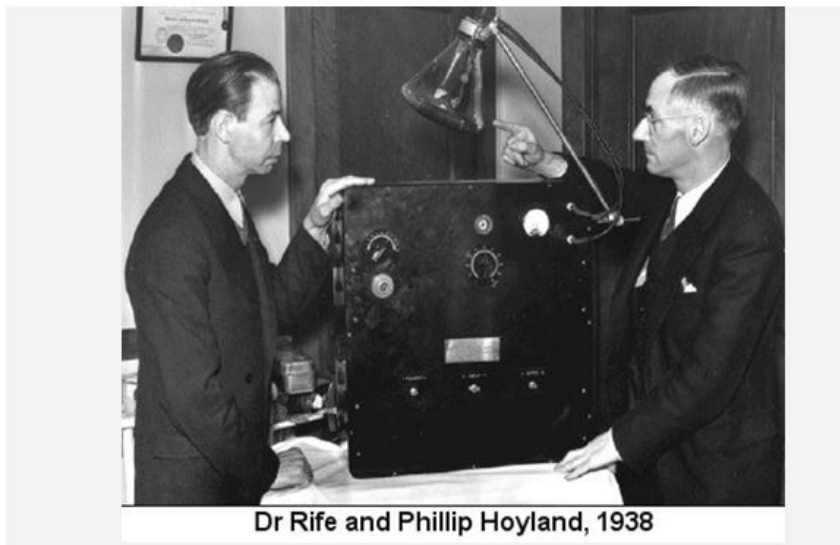
Dr Rife and Phillip Hoyland, 1938

Nešto ranije jedan "slučajni" požar uništio je nekoliko milijuna dolara vrijedan laboratorij Bumett u New Jerseyu, upravo kada su se tamošnji znanstvenici pripremali objaviti potvrdu Rifeovog rada, a kao kruna svega pojavila se i policija koja je sve preostale dokaze i materijali iz Rifeovih pedesetogodišnjih istraživanja protuzakonito zaplijenila.