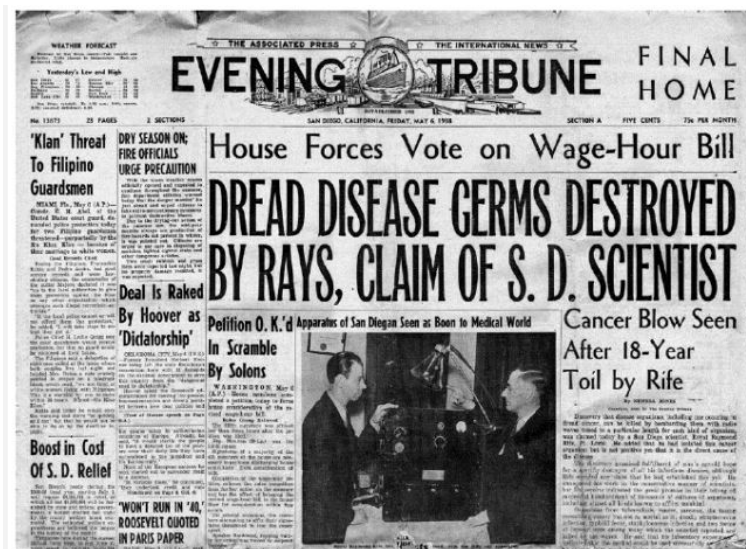
Jedan od rijetkih novinskih tekstova posvećenih tadašnjem otkriću R. Rifea.

Arthur Kendall, koji je radio s Rifeom na virusu raka, prihvatio je iznos od gotovo 250 000 dolara da se odjednom "povuče" u Meksiko. U vrijeme ekonomske depresije to je bio velik novac.